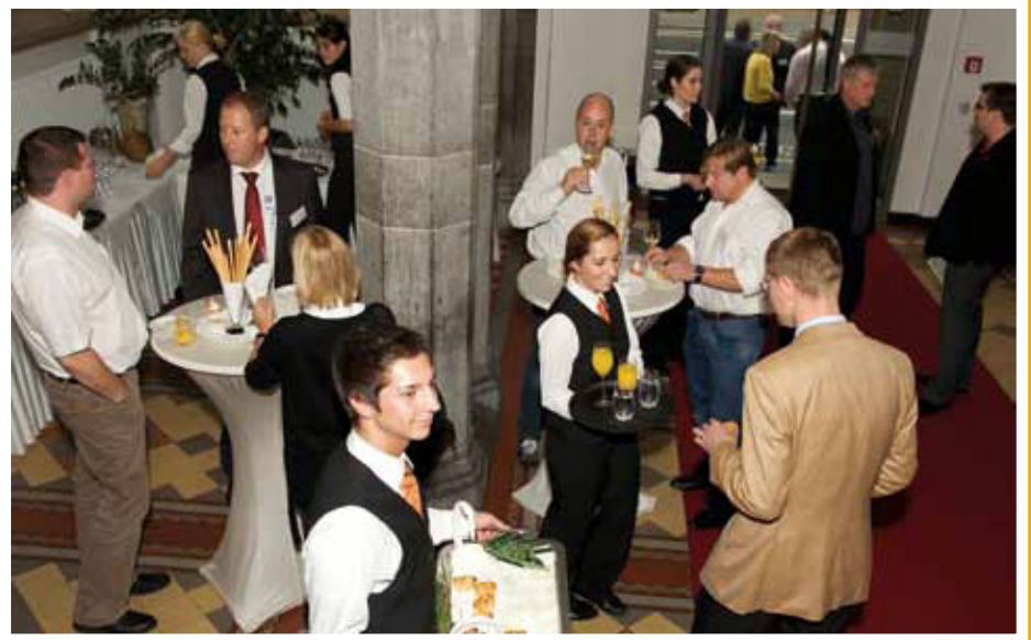
Kleine Stärkung kurz vor der Preisverleihung